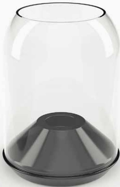
Cloche MATTER design by Alain Gilles

La cloche Matter a été imaginée par le designer Alain Gilles pour s'adapter à toutes les envies. Avec sa base en céramique noire et sa cloche en verre soufflé ouverte en son sommet, elle se transformera tour à tour en bougeoir, en photophore, en vase, en élément de décoration au gré des envies et des besoins.