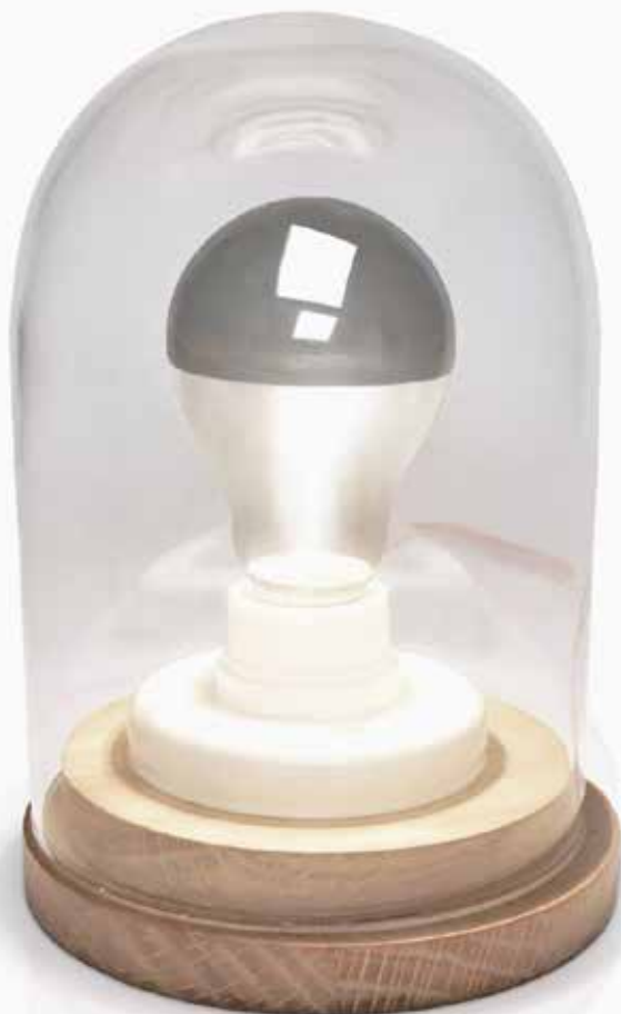
Lampe PRÉCIEUSE design by Gesa Hansen

Indispensable au confort et au bien-être du foyer, la lumière est un des éléments clefs d'une décoration réussie. La lampe Précieuse imaginée par la designer Gesa Hansen, avec sa cloche en verre soufflé et sa base en chêne massif joue les élégantes tout en distillant une belle lumière chaleureuse.