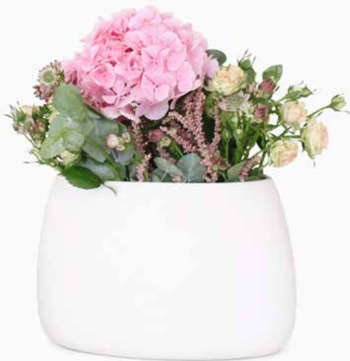
Vase LILY design by Louisa Koeber

Éléments de décoration, les fleurs apportent de la vie dans la maison au gré des saisons. Avec sa forme oblongue le vase Lily créé par Louisa Koeber donnera du volume à chacun de vos bouquets. Petit plus ? on le retournera en hiver pour y déposer quelques pétales fanés, pot-pourris ou tout objet de son choix.